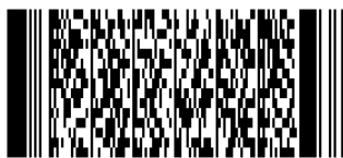
Osnovni PLUS panel